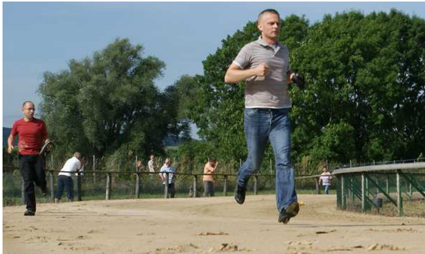
nicht nur für Windhunde, auch die Menschen müssen sich sportlich und schnell bewegen !