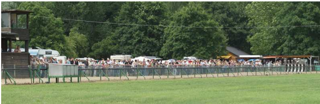
sehr viele Zuschauer schon bei den Vorläufen