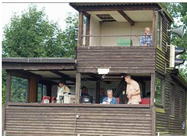
Hasenzug, Zeitnahme und Moderator