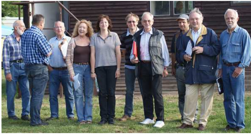
Bahnbeobachter und Schiedsrichter "bei der Arbeit"