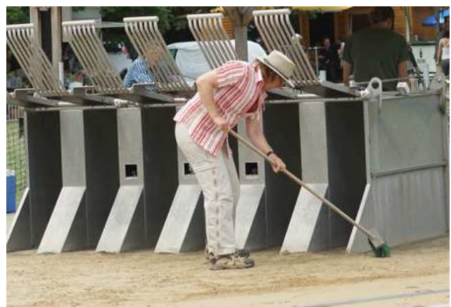
Bahnpflege mit grossen und kleinen Geräten