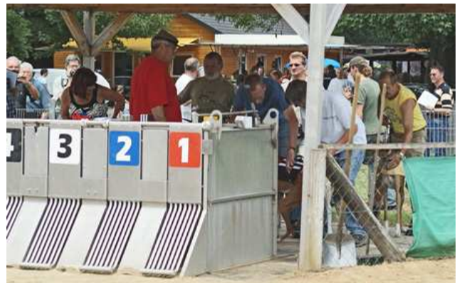
und einsetzen der Hunde